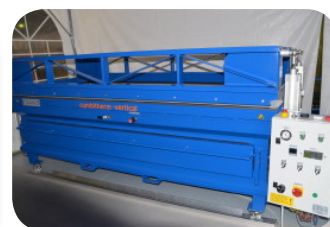
Combitherm Vertical Ofen Vakuumpresse